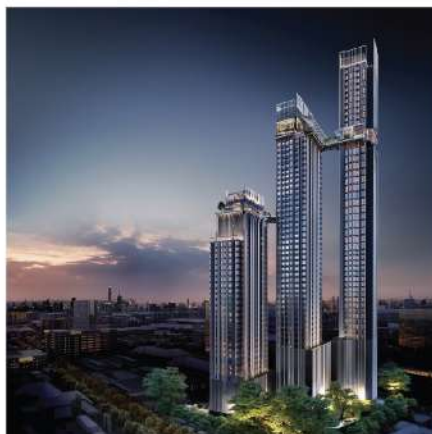
Park Origin Thonglor