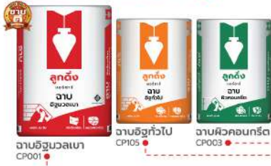
ฉาบอิฐมวลเบา CP001 ฉาบอิฐทั่วไป CP105 ฉาบผิวคอนกรีต CP003