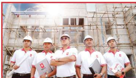
QUICK Technical Support บริการเทคนิคที่รวดเร็ว