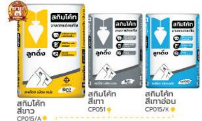
skimโค้ท สีขาว CP015/A skimโค้ท สีเทา CP051 skimโค้ท สีเทาอ่อน CP015/K