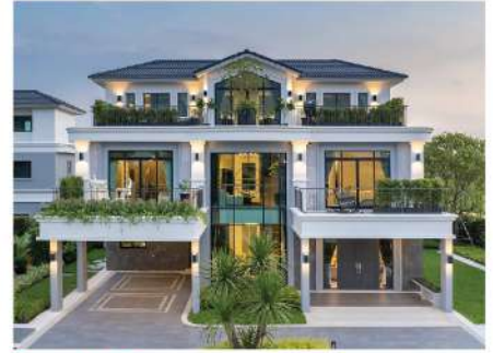
Supalai Elegance Pinklao