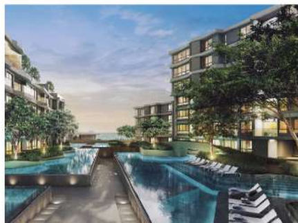
Veranda Residence Hua Hin