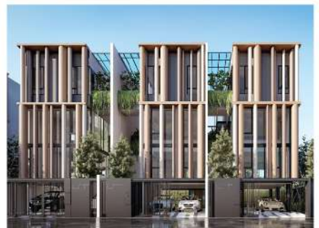
Baan puripuri Lat Phrao 41