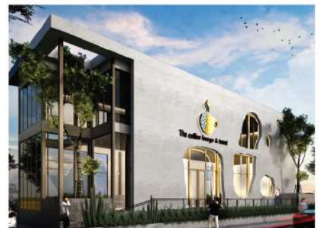
The Coffee Lounge & Forest Ratchapruerk