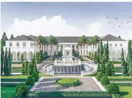
Reignwood Park Pathumthani