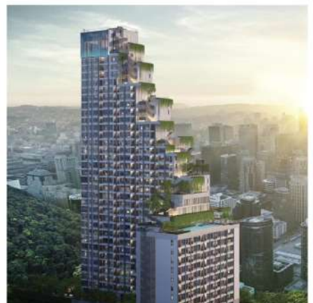
Hampton Residence Phyathai