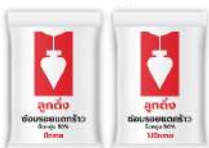
ซ่อม รอยแตกร้าว CP046/E ซ่อม รอยแตกร้าว CP046/E1