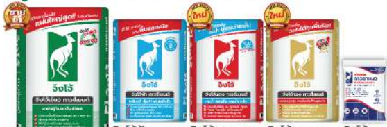
จิงโฉง ใยแก้ว กาวซีเมนต์ JA201 จิงโฉง ฟ้า กาวซีเมนต์ JA101 จิงโฉง แดง กาวซีเมนต์ JA301 จิงโฉง ทอง กาวซีเมนต์ JA401 จิงโฉง กาวยาแนว CP064