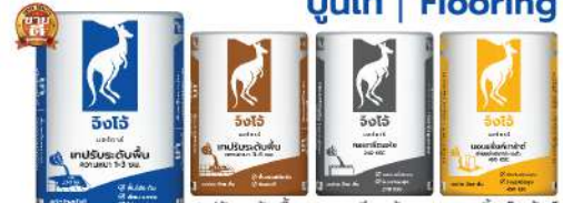
เทปปรับระดับพื้น ชนิดโพลีเอทิลีน JF101 เทปปรับระดับพื้น CP009 คอนกรีตแห้ง CP104 นอนซีเมนต์เกร้าท์ CP052