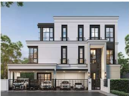
Malton Gates Krungthep Kreetha