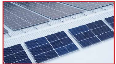
พลังงานไฟฟ้าจากแสงอาทิตย์