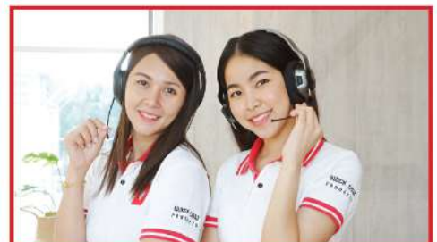
QUICK Customer Service บริการลูกค้าสัมพันธ์ที่กันใจ