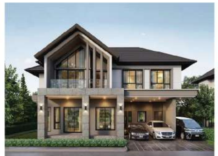
Bangkok Boulevard Rama 9 Raminthra - Seri Thai 2