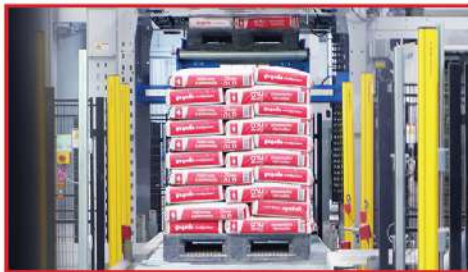
ใช้ระบบการผลิตหุ่นยนต์