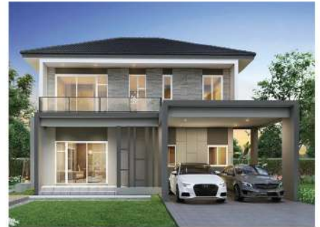
Baan Ratchapruerk Ladkrabang