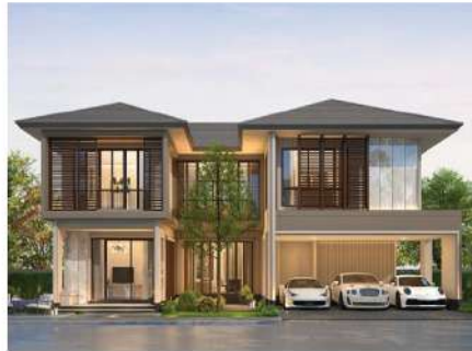
Burasiri Krungthep Kreetha