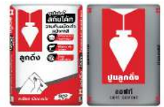
ซูเปอร์skimโค้ท สีขาว CP015/B skimโค้ท สีเทาอ่อน CP015/L