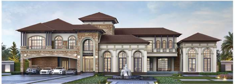
The Grand Pinklao