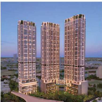
Whizdom the Forestias Bangna