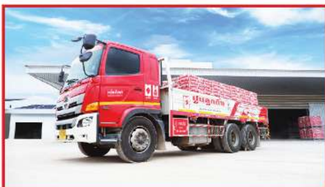
QUICK Delivery บริการขนส่งที่จับใจ

สำนักงานใหญ่ ของเราตั้งอยู่บน ถนนนครอินทร์ จังหวัด นนทบุรี โดดเด่นด้วยบริการซึ่งเป็นหัวใจของควิกโคท เราใส่ใจ ในทุกรายละเอียด เพื่อให้มั่นใจว่าลูกค้าทุกท่านจะได้รับแต่ประสบการณ์ ที่ดีที่สุด ตั้งแต่เริ่มต้นจนไปถึงหลังการขาย โดยเน้นการสนับสนุน และแก้ปัญหาร่วมกับลูกค้า และผู้ใช้ผลิตภัณฑ์ของเรา พร้อมให้บริการ ด้วย 3 ทักษะคุณภาพ