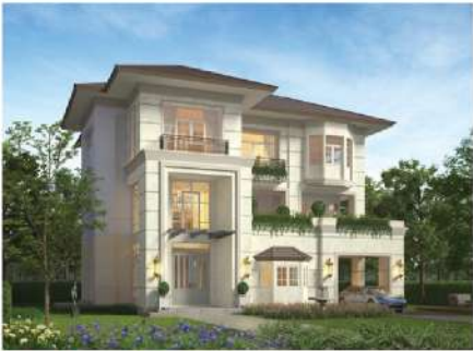
The Crystal Solana Ekamai - Raminthra