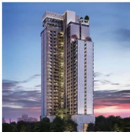
Once Pattaya Pattaya