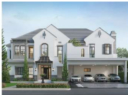
Nantawan Rama 9 - New Krungthep Kreetha