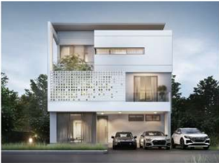
Nirvana Absolute Bangna