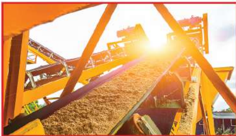
วัตถุดิบคุณภาพ