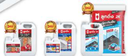
ลูกตัง นํ้ายา เคลือบผนัง สูตรน้ำ DS-22 ลูกตัง นํ้ายา ปะสานคอนกรีต DB-77 ลูกตัง 2K ซีเมนต์ทาภายนอก DW201