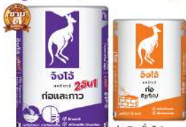
ก่ออิฐมวลเบา & กาวติดกระเบื้อง CP007 ก่ออิฐทั่วไป CP008