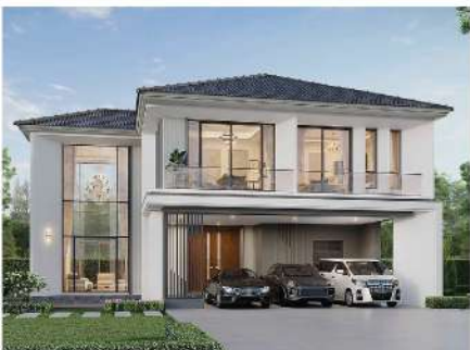
Silverlake Vind Suwinthawong 78 - Nong Chok