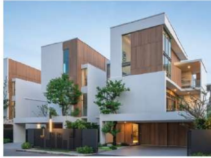
Vive Rama 9 Krungthep Kreetha