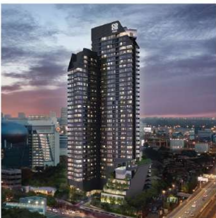
Coco Parc Condo Rama 4