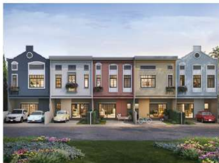
Siri Place Ratchapruek - Nakhonin